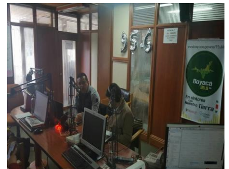
EMISORA DE LA GOBERNACIÓN DE BOYACÁ