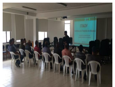
Empresa Colconcretos, Nobsa