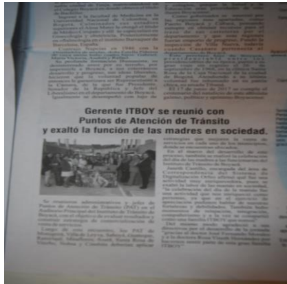
PERIODICO RENOVACIÓN INTERNACIONAL