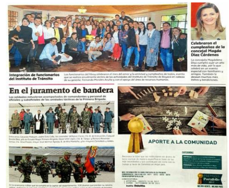
PERIODICO BOYACÁ 7 DIAS