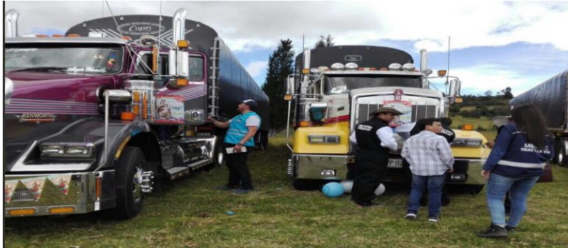
Fiestas de la Virgen del Carmen Chiquinquirá