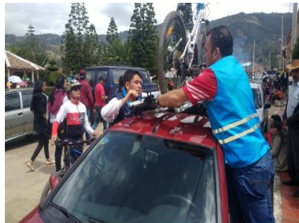
Fiestas Municipales Floresta