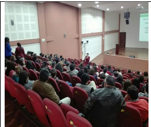
I.E: Técnica Nacionalizada de Samacá, Técnica la Libertad, Técnica Salamanca, municipio de Samacá