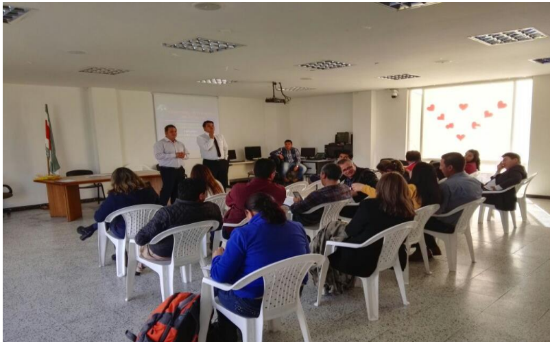
Capacitación en Salud Pública