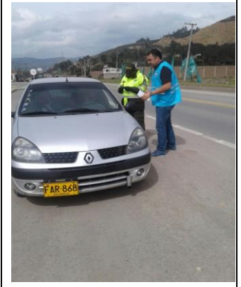
Sector entrada Holcim municipio de Nobsa.