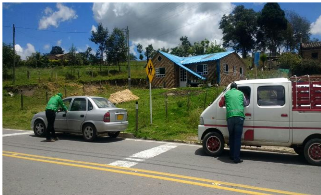
Sector Portachuelo en Santa Rosa de Viterbo