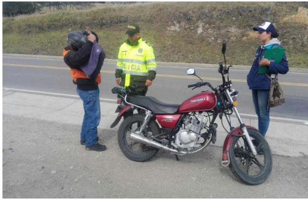
Vía Tunja- Arcabuco sector alto del sote y sector alto el moral