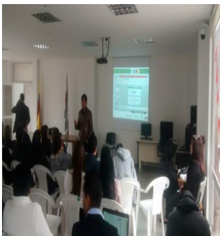
Capacitación contaminación ambiental