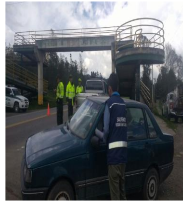
Sector puente peatonal, I.E normal superior municipio de Saboya