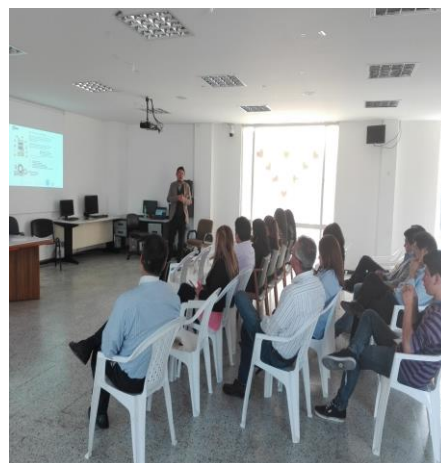
Capacitación en Comunicaciones y Tecnología