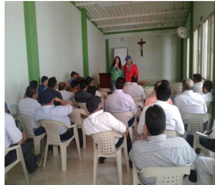
Empresa Cootradatil y Cootrasoata, (discapacitados) municipio de Nobsa