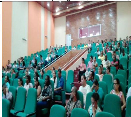
I.E: Jhon F Kennedy, San Pedro Claver y José Antonio Galán en Puerto Boyacá.