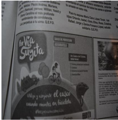
PERIODICO CABOS Y PUNTAS