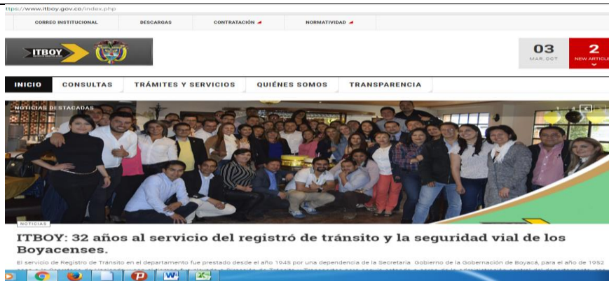
PAGINA DEL ITBOY