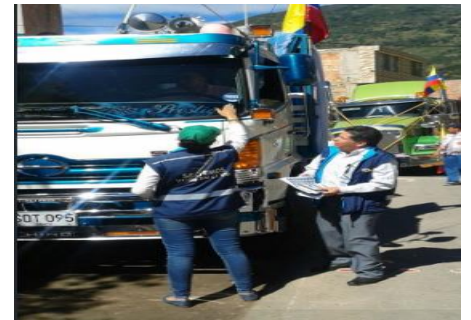
Fiesta virgen del Carmen Municipio de Soata