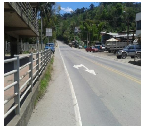
Bandas reductores Moniquira