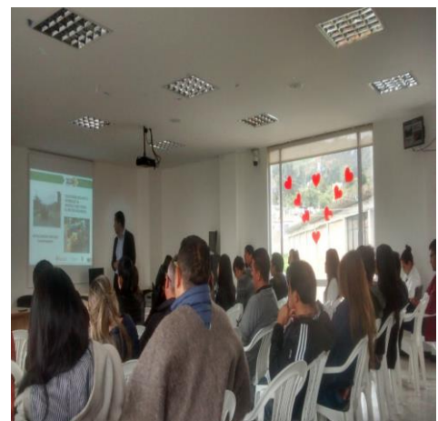
Capacitación en buen conductor