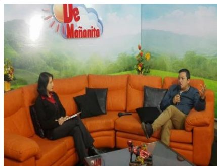
KANAL DE TELEVISIÓN EL KANAL 6 – MAGAZÍN DE MAÑANITA