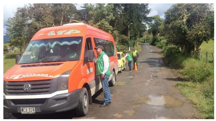
Sector la virgen en el municipio de Pachavita.