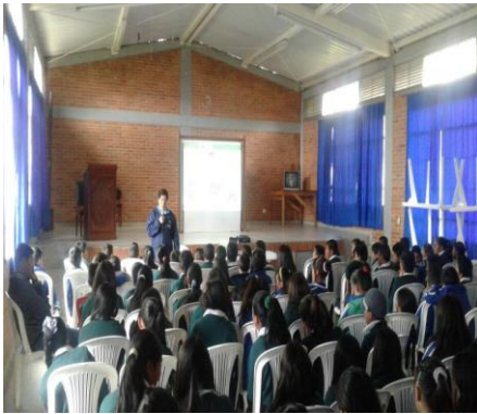
I.E. Puerta de Tota