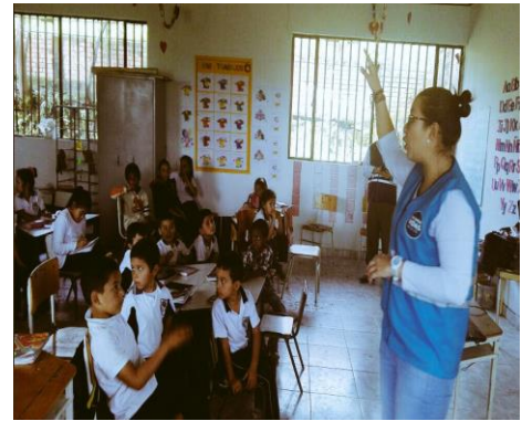
I.E. El Jordán de la vereda Pajales de Monquirá