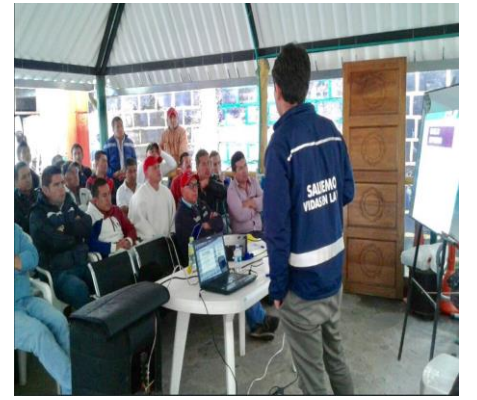
Empresa Cootransgar de Garagoa