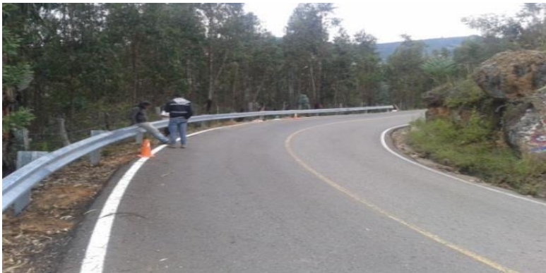
Defensa Metálica y señalización horizontal Vía Santa Rosa de Viterbo – Floresta