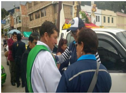
Fiesta virgen del Carmen Municipio de Cerinza