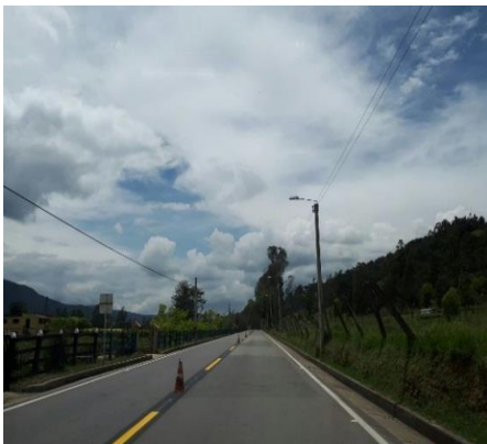
Vía señalizada Belén