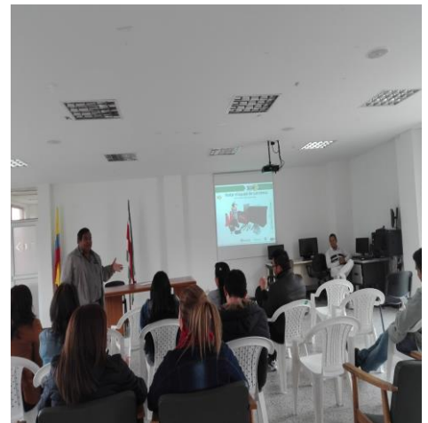
capacitación en ley 1680 alcoholismo