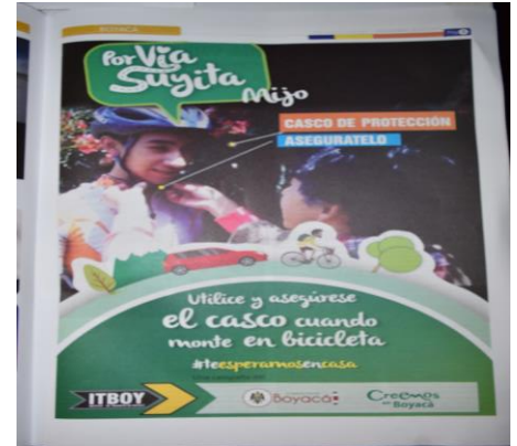
PERIODICO HAGAMOS NOTICIAS