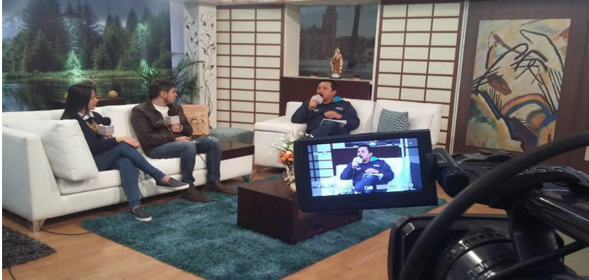
TELESANTIAGO – MAGAZIN