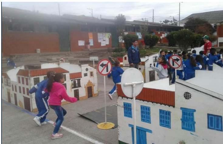
Institución Educativa Normal Superior de Saboya