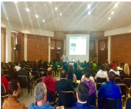
Universidad Pedagógica y Tecnológica de Colombia (UPTC)