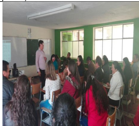
I.E: Rancho Grande y San Rafael Municipio de Rondón