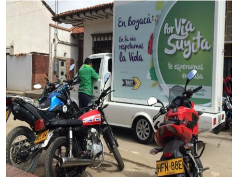
Encuentro de motociclistas Firavitoba