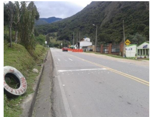
Bandas reductores Arcabuco